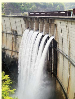
川治ダム 地上60mのキャットウォークでダムの大きさを実感